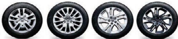
16" Black steel wheels with full wheel 17" Black steel wheels with full wheel 17" Silver alloy wheels with chrome 17" Bi-colour diamond cut alloy